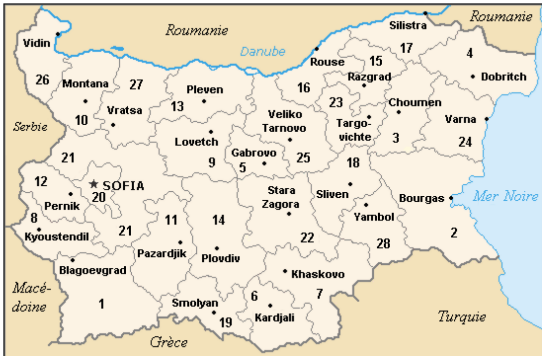
OBLASTI DE BULGARIE