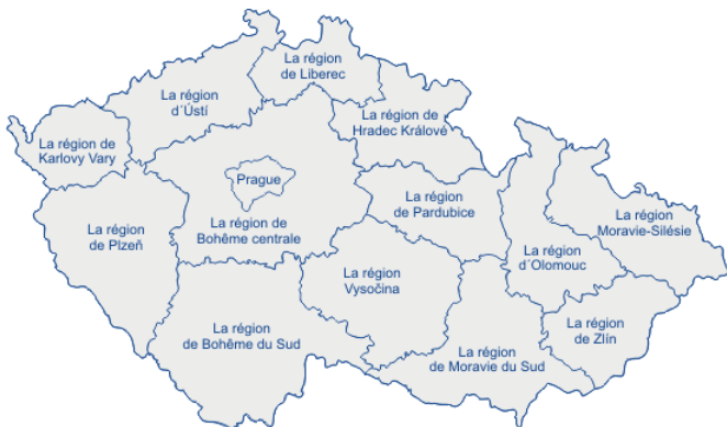
Carte administrative des régions