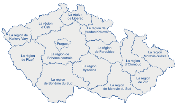
Carte administrative des régions