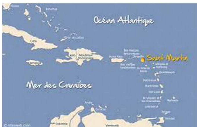
Carte de situation de l'île de Saint-Martin

Chef-lieu : Marigot (préfecture pour St-Barthélémy et St-Martin) Population : 74.066 hab. (35.107 côté français et 38.959 côté néerlandais) Superficie : 93 km 2 Statut : département et région d'Outre-mer Langues locales : Français dans la partie française, Néerlandais et anglais dans la partie néerlandaise.