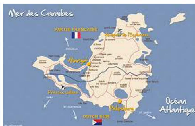
Saint-Martin (partition française et hollandaise)